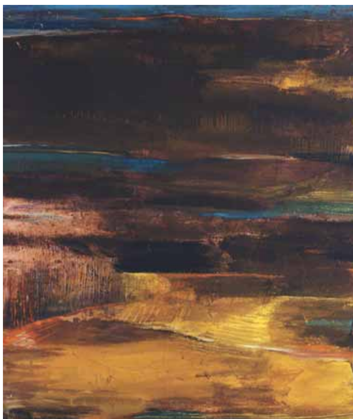
شیرین اتحادیه، بدون عنوان، ترکیب مواد روی بوم، ۱۶۰×۲۰۰×۱۳۹۲