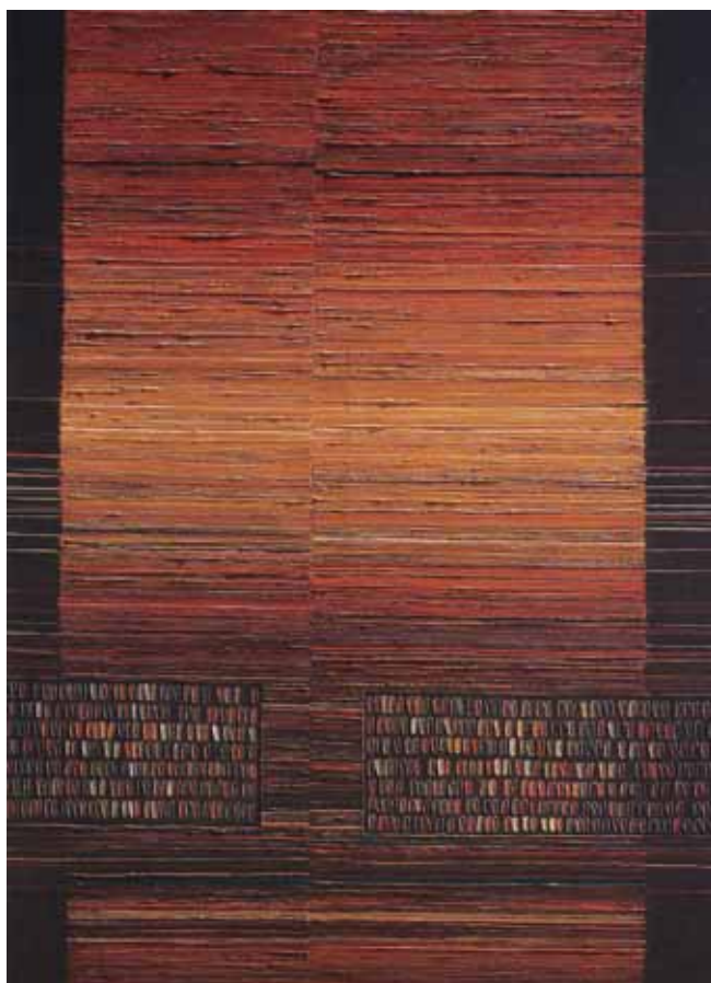
رضا بهاروند، بدون عنوان، ترکیب مواد روی بوم، ۱۳۹۱، ۱۹۶×۱۴۴