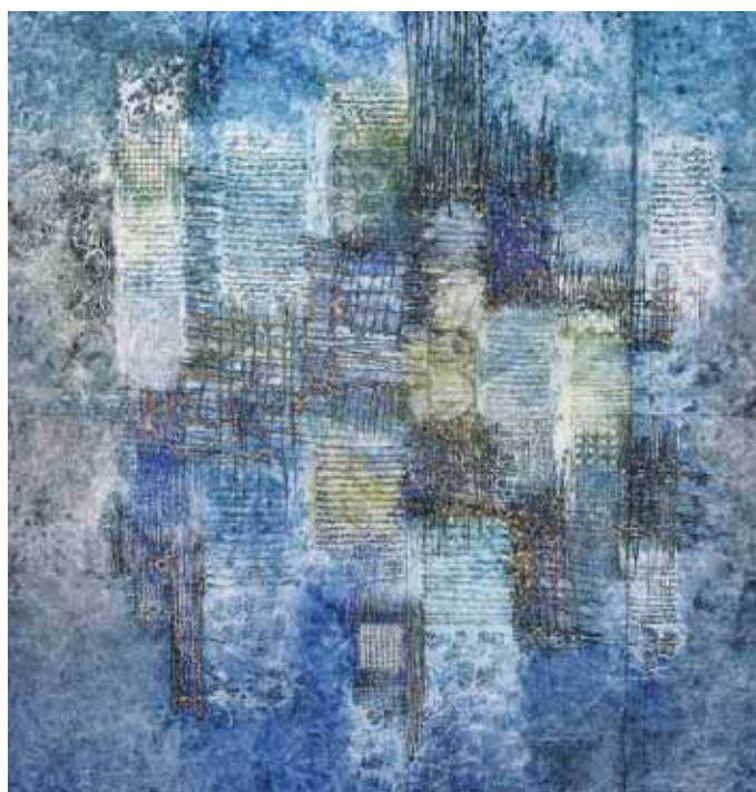
هادی جمالی، بدون عنوان، ترکیب مواد روی چوب، ۱۳۸۶، ۱۲۰×۱۲۰