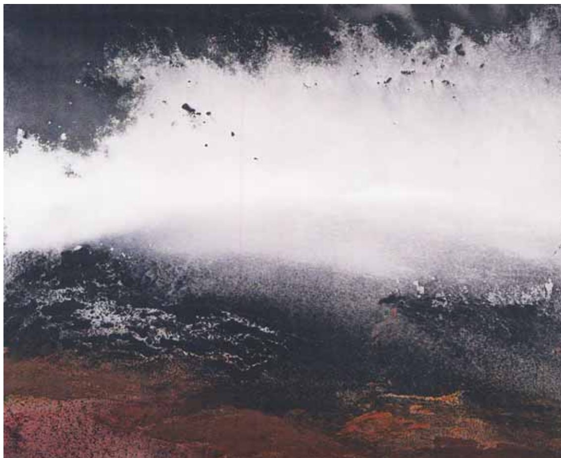
▲ مصطفی دشتی، بدون عنوان، اکریلیک روی بوم، ۲۲۰×۱۰۲۰×۱۳۹۱